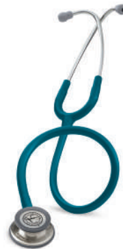
5623 カリビアンブルー