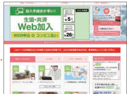
※画像は2021年度版です。